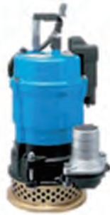
HSE2.4S (センサー付) (ツルミ)