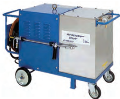
HPJ-37TX III (ツルミ)