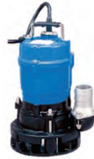
HSN2.4S (泥水用) (ツルミ)