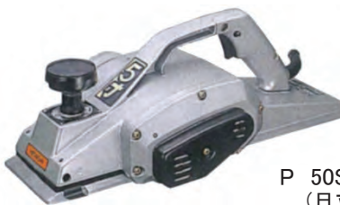
P 50SA (SC) (日立工機)