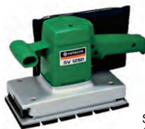
SV 12SD (日立工機)