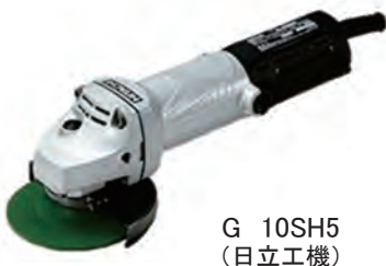
G 10SH5 (日立工機)