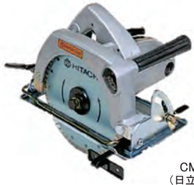
CM 8 (日立工機)