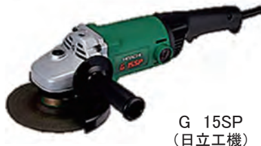
G 15SP (日立工機)