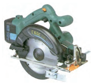
C 6DC (日立工機)