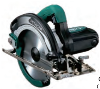
C 7MB4 (日立工機)