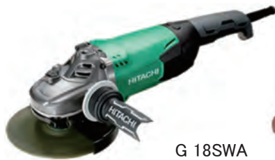
G 18SWA (日立工機)