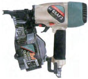
NV 65AF3 (日立工機)