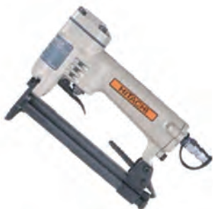
N 1410A (日立工機)