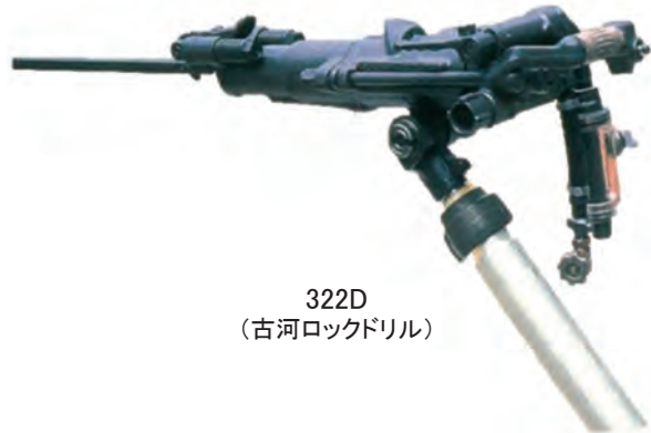
322D (古河ロックドリル)