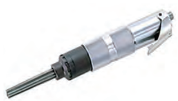
JEX-20 (ストレートタイプ) (日東工器)