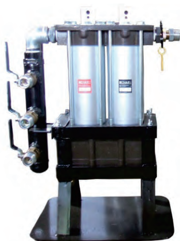
M-120A-5 (前田シェルサービス)