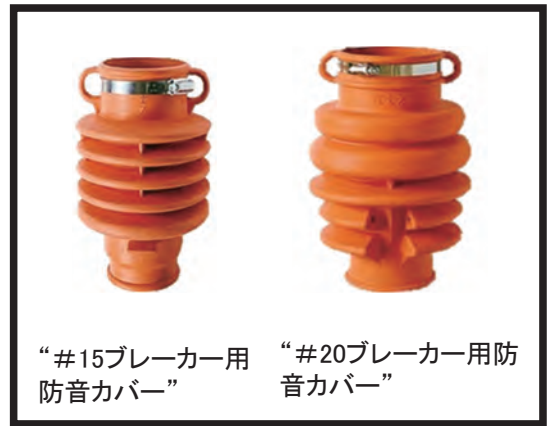
“#15ブレイカー用 防音カバー”