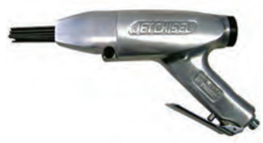
JEX-24 (ガンタイプ) (日東工器)