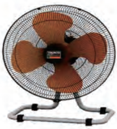
置型扇風機 (トラスコ)