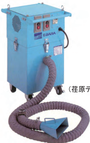
EJF1 (荏原テクノシステム)