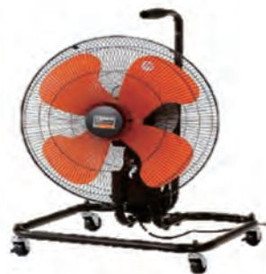
キャスター付扇風機 (トラスコ)