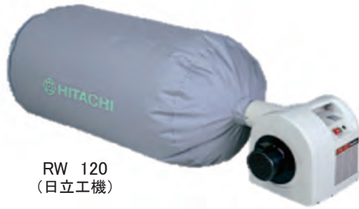
RW 120 (日立工機)