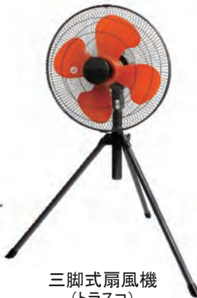
三脚式扇風機 (トラスコ)