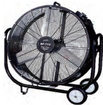
大型扇風機 (ナカトミ)