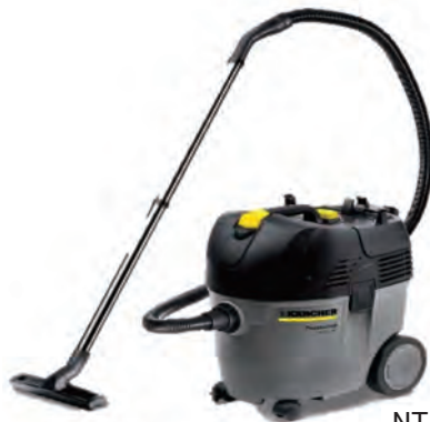
NT35/1 Ap (ケルヒヤー)