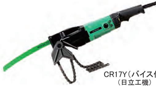
CR17Y(バイス付) (日立工機)