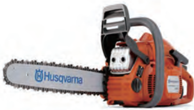
445e (ハスクバーナーゼノア)