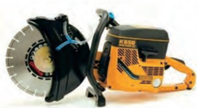
K650 ACTIVE III (ハスクバーナ)