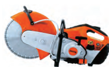
TS500 i (スチール)