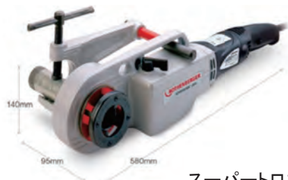
スーパートロニック (アサダ)