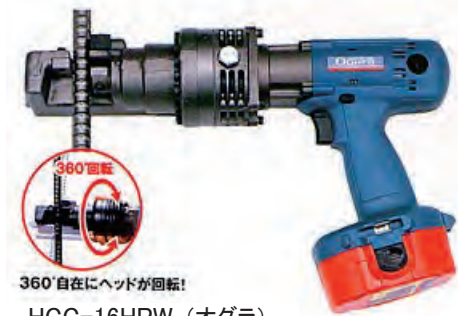
360°自在にヘッドが回転! HCC-16HPW (オグラ)