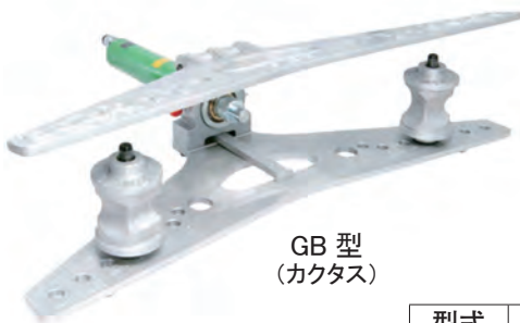
GB 型 (カクタス)